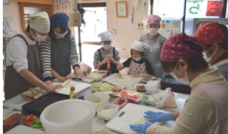
きららハウスのパン工房でピザパンを作る親子ら

高山市から委託を受けた事業、冬休み学童保育に昨年12月28日、3組の親子7人が参加し、ピザを作りました。三福寺町のきららハウスパン工房で開催。最初に丸めたピザ生地を自分の好きな形にし棒を使ってコロナと伸ばして整形しました。次にオリブオイルやピザソースなど