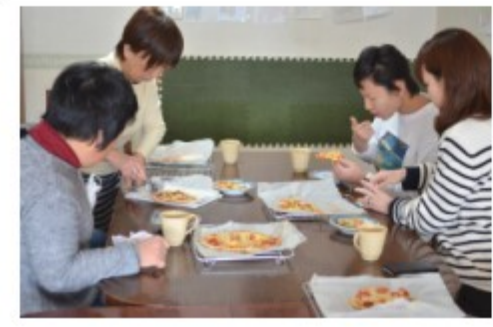
完成したピザ(下)をみんなで食べました(左)