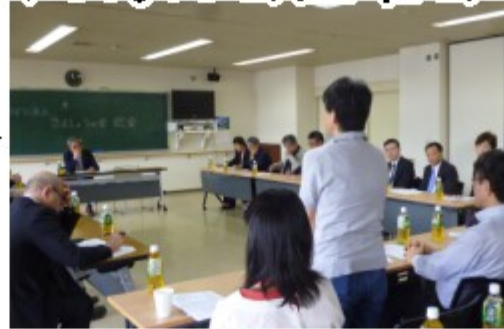
2019年通常総会の様子