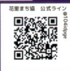
花里まち協 公式ライン