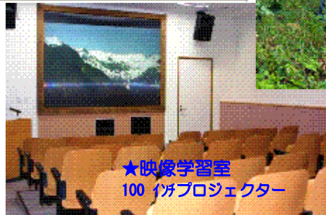
★映像学習室 100インチプロジェクター