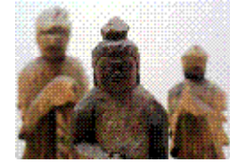
円空 不動明王・十一面観音・今上皇帝像